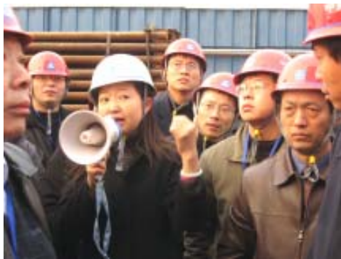
参观国家体育场工程