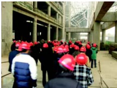
参观 CCTV 新台址工程