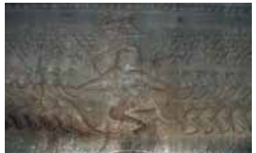
图8 东壁的搅乳海图