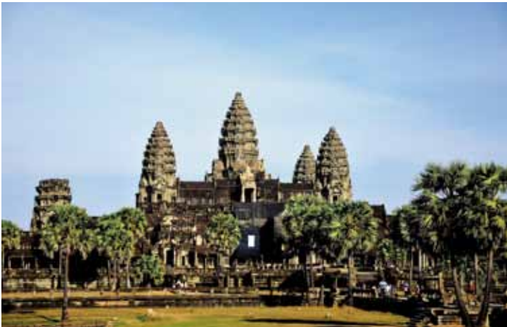
图6 五座宝塔象征须弥山