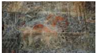
图9 苏利耶跋摩二世骑象出征图

后，中供佛像，三面用佛像壁围拢，仅留一面作为朝拜通道。无数的参观者，即使怀着不同的宗教信仰，只要来到了吴哥窟，都无不被建筑和空间中传达出来的信仰和精神所影响和打动。