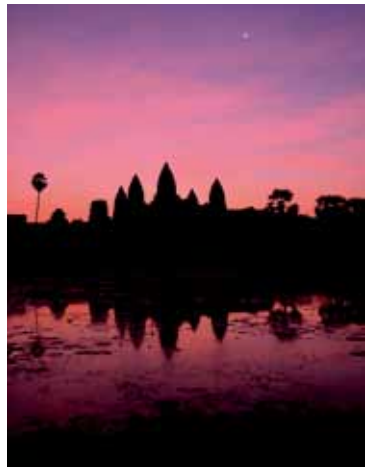
图5 梦幻般的吴哥窟日出