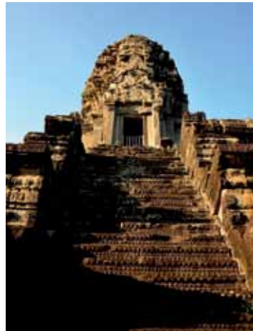
图7 陡峭的石砌踏步