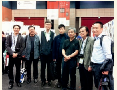
部分参会中国建筑师合影