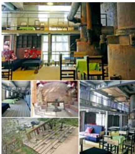
图5 既有空间诱发新功能