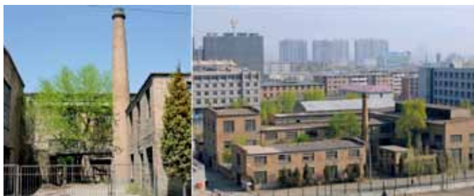
图1 旧厂房改造前处于废弃状态

寻找最佳功能即为第一个设计策略。区别于根据使用功能设置空间的一般模式，采取空间优先的设计策略。即对厂房的空间特征进行适应性评价，在可能的范围内赋予最适宜的使用功能，以最少的用功创造最大化的空间使用模式。这是一种着眼于生态集约的设计操作。在内蒙古工业大学的旧厂房改造项目中，首先针对其空间开放的特点，定位为重交流、重体验、重实践的建筑学教学场所——建筑馆，否定了作为其它学科的实验场馆以及因需分隔不符合绿色初衷的校园文化中心（音、体、美的功能彼此