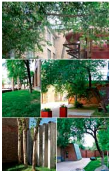
图10 保留院中原有树木

天然采光，节约了照明能耗（图9）；3）利用废旧材料，节约了材料和运输的费用；4）采用低温地面辐射采暖加明管的方式，节约了采暖能耗；5）大量使用钢、玻璃等循环建材，提高了材料的长效利用率；6）保留树木，增强了生态效应（图10）。