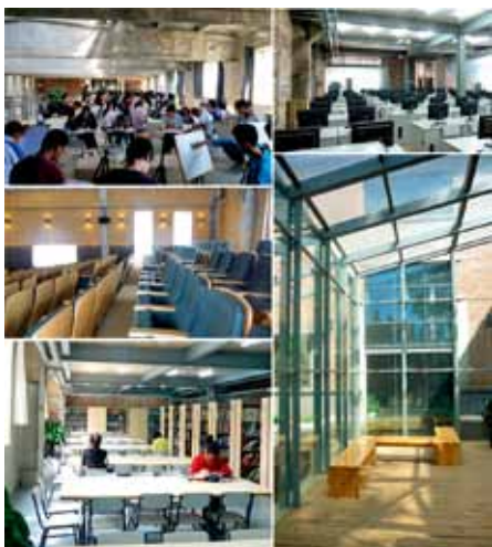
图4 新功能适应既有空间