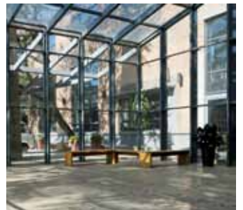
图12 可以交流的阳光门厅